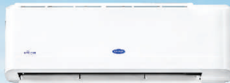
รุ่น 42TEVGB024-703 รุ่น 42TEVGB028-703