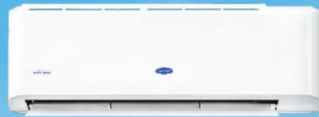
รุ่น 42TEVGB013-703 รุ่น 42TEVGB018-703