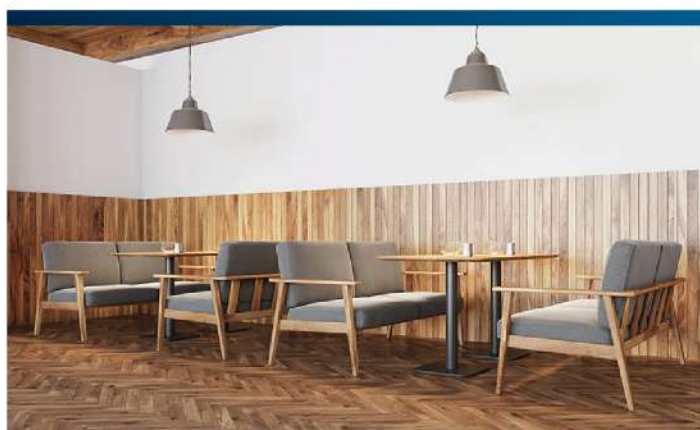
ร้านอาหาร / ร้านกาแฟ