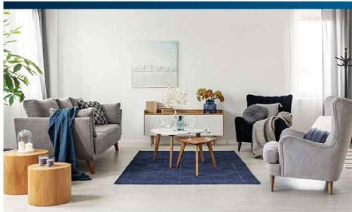
ห้องนั่งเล่นขนาดใหญ่

Big Wall รุ่น FAVF36UV2S สำหรับห้องขนาด 36-50 ตรม.* และ รุ่น FAVF30WV2S สำหรับห้องขนาด 30-42 ตรม.*