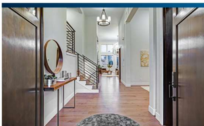
โถงทางเดิน