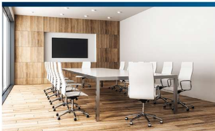
ห้องประชุม

*ขนาดทำความเย็นที่เหมาะสมขึ้นอยู่กับ สภาพแวดล้อมภายในและภายนอกห้อง เช่น ทิศของห้อง แสงแดด จำนวนผู้ใช้งาน เป็นต้น