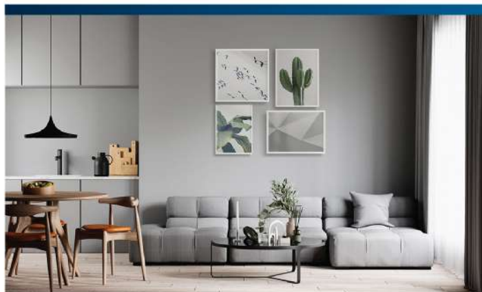
คอนโด / ห้องทานข้าวแบบเปิดโล่งเชื่อมห้องนั่งเล่น