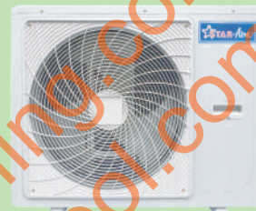
Model CR-18 - CR-33 Model CR-30-3 - CR-33-3