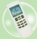
รีโมทคอนโทรล ไร้สายแบบ Digital