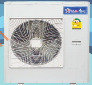
Model CR-365A - CR-365-3B