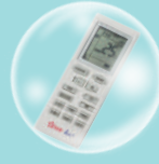
รีโมทคอนโทรล ไร้สายแบบ Digital