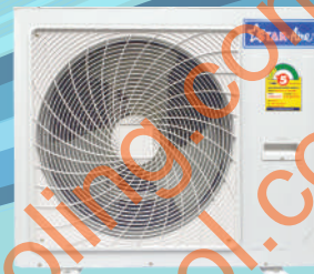
Model CR-255 CR-305A