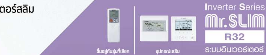
ยื่นอยู่กับรุ่นที่เลือก

ปรับแรงดันปั๊มน้ำทิ้งให้มีประสิทธิภาพเพิ่มขึ้น จากระยะความสูง 400 มม. เป็น 600 มม. ให้ความยืดหยุ่นในการจัดวางท่อ และตำแหน่งในการติดตั้งเครื่อง