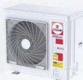
Model : CCS-32IVGX40, 48