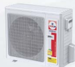
Model : CCS-32IVGX36