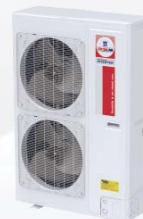
Model : CCS-32IVGX60