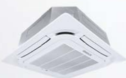
Model : CFC-32IVGX13