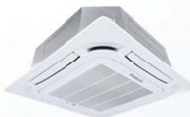
Model : CFC-32IVGX36, 40, 48, 60