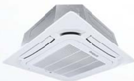
Model : CFC-32IVGX18, 24, 30